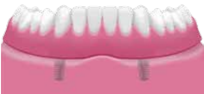
Twee implantaten voorzien van een uitneembare prothese.