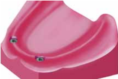
Twee implantaten in de onderkaak.